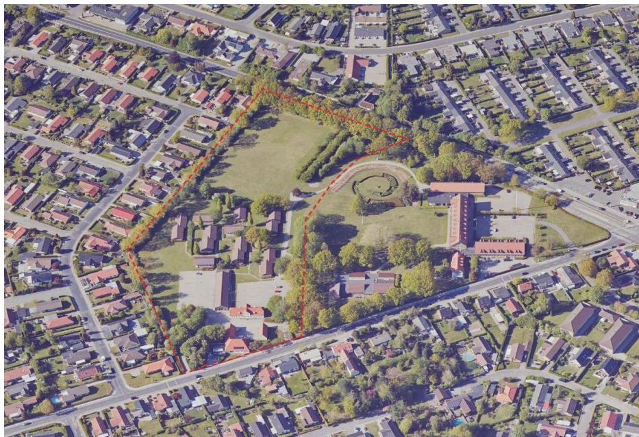
Luftfoto af området. Lokalplanens afgrænsning er vist med stiplede rødt.

Lokalplanområdet er beliggende i forstaden Paarup mellem Paarupvej og Rugårdsvej på et areal, der tidligere har været tilknyttet nabobebyggelsen Tietgenskolen. Mod øst ligger Tietgenskolen med tilhørende parkområde, vest for ligger der et parcelhusområde. Inden for lokalplanområdet ligger der i dag en gårdbebyggelse og en række nedlagte elevboliger med tilhørende parkering. Området fremstår generelt meget grønt med buske, træer, fodboldbane og beplantningsbælter som vist på luftfotoet nedenfor.