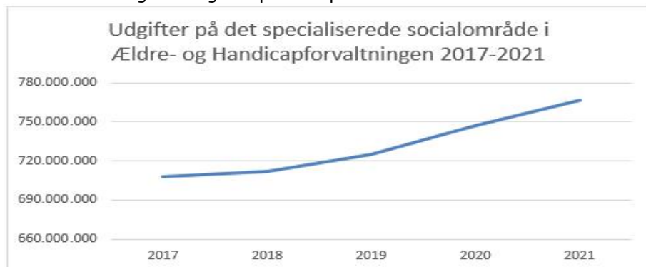
Tabel - Udviklingen i udgifter på det specialiserede socialområde 2017-2021

Forvaltningen bemærker også, at Odense Kommune er en af de kommuner i Danmark med færrest udgifter pr. 18-66 årig på voksenhandicapområdet. Derudover forventer Borgmesterforvaltningen ikke, at området vil blive tildelt midler i de kommende års økonomiaftaler mellem regeringen og KL. Dette skyldes ikke mindst situationen i Ukraine og de øgede udgifter til forsvarsområdet. Ældre- og Handicapforvaltningen vurderer på den baggrund, at udvalget må forventes selv at skulle finde løsninger, som skaber et budget i balance.