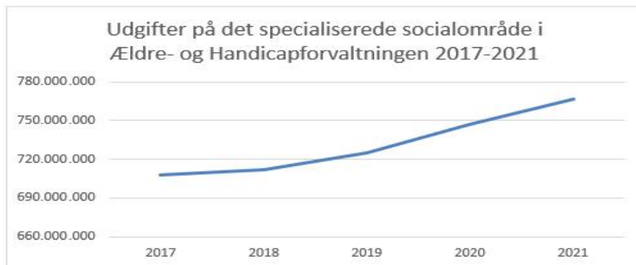
Tabel - Udviklingen i udgifter på det specialiserede socialområde 2017-2021

Forvaltningen bemærker også, at Odense Kommune er en af de kommuner i Danmark med færrest udgifter pr. 18-66 årig på voksenhandicapområdet. Derudover forventer Borgmesterforvaltningen ikke, at området vil blive tildelt midler i de kommende års økonomiaftaler mellem regeringen og KL. Dette skyldes ikke mindst situationen i Ukraine og de øgede udgifter til forsvarsområdet. Ældre- og Handicapforvaltningen vurderer på den baggrund, at udvalget må forventes selv at skulle finde løsninger, som skaber et budget i balance.