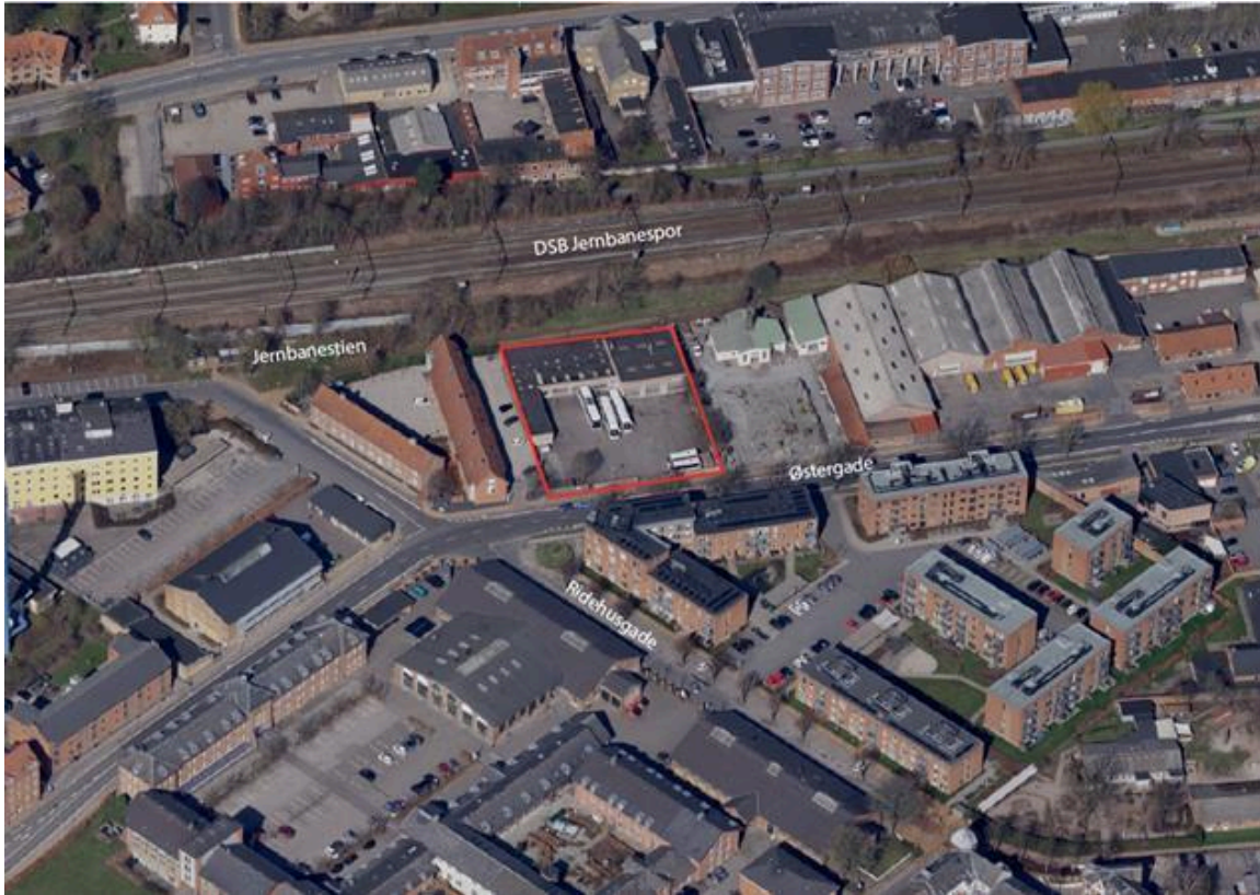
Luftfoto af lokalplanområdet (markeret med rød streg)