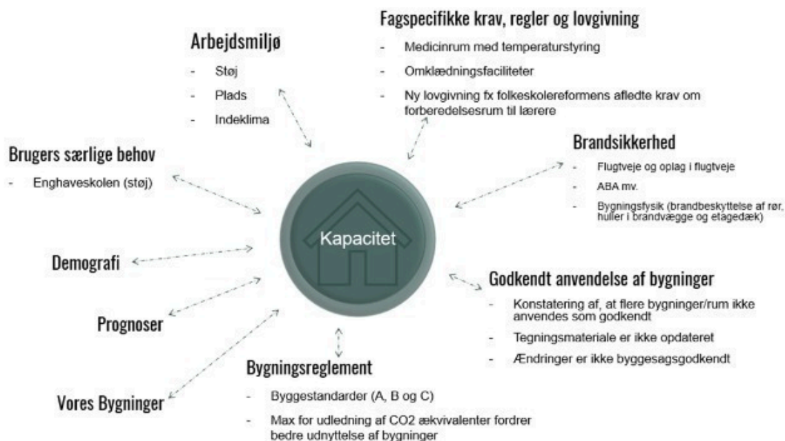
Figur 1: Udfordringer og påvirkninger på Odense Kommunes bygningsmasse

Odense Kommune oplever flere forudsigelige udfordringer med bygningsmassen i forhold til kapacitet, arbejdsmiljø og påbud. Det er Arbejdstilsynet, brandinspektion og sundhedsmyndighederne, der udsteder påbud. Som figur 1 illustrerer, er dette blot nogle af de ting som påvirker bygningsmassen og udfordrer kapaciteten. Løsninger er som problemet alsidige og kan handle om både adfærd, organisering, men også de fysiske rammer. Det afhænger af det enkelte konkrete problem, det enkelte konkrete sted.