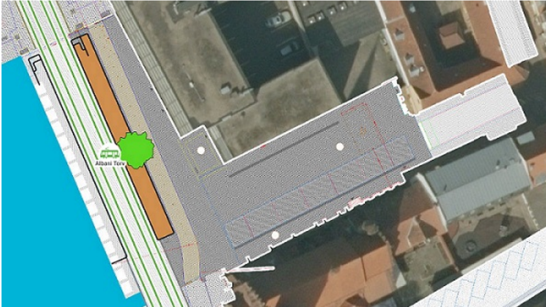
Projekt for letbanestation ved Albani Torv og renovering af Adelgade som vist på odenseletbane.dk