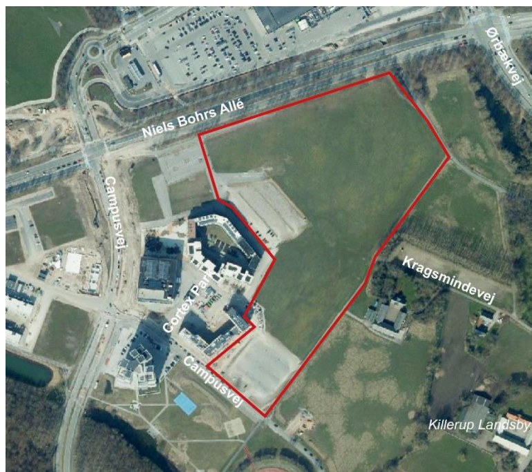
Luftfoto af lokalplanområdet (rød afgrænsning) samt de omkringliggende områder og veje.

Lokalplanområdet er beliggende mod Ørbækvej og Killerup Landsby. Statens Ejendomsselskab, Freja ejendomme A/S, er grundejer og projektudvikler for Cortex Park. Freja ejendomme ønsker med denne lokalplan at udvikle den sidste del af Cortex Park.