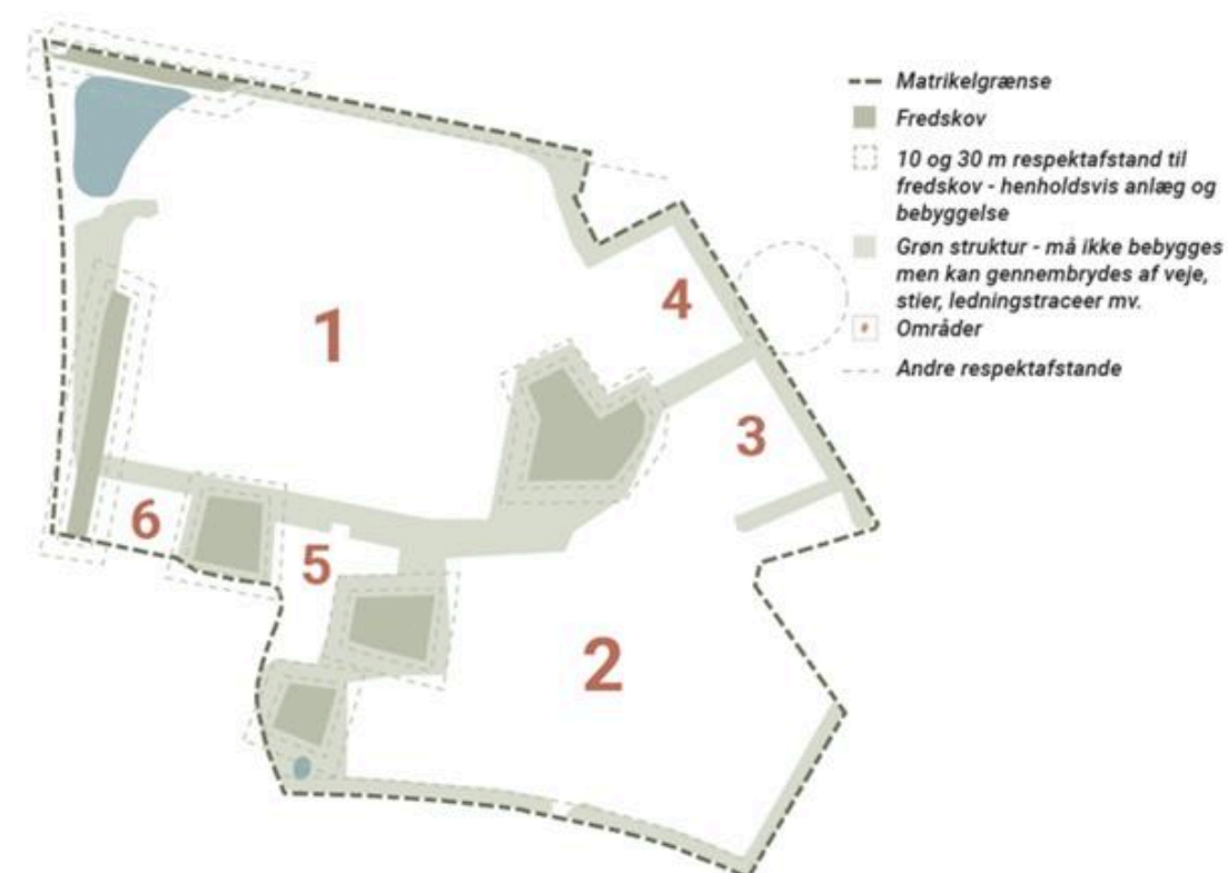
Figur 1: Områdeopdeling.

Den grønne struktur opdeler arealet i et område 1 mod nord og et område 2 mod syd. Områderne 1 og 2 er disponeret til produktionsfaciliteter. Område 3 er disponeret til energiforsyning. Områderne 4 og 6 er reserveret til forskellige supportfunktioner, herunder p-huse. Område 5 er disponeret til fælles funktioner som kontor og administrative bygninger. Det nordlige område omfattende områderne 1, 3, 5 og 6 vil blive bebygget først.