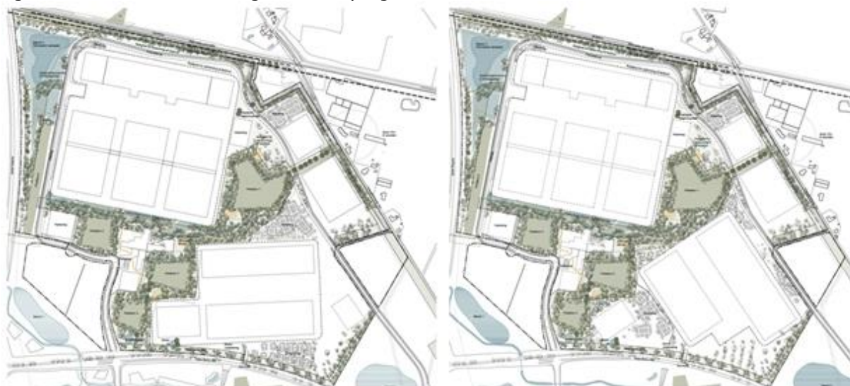
Figur 2: Alternativ udformninger af det sydlige område.

Som det fremgår af figur 2, muliggør projektet forskellige udformninger af det sydlige produktionsområde, idet bygningerne i de to alternativer placeres forskelligt indenfor området.