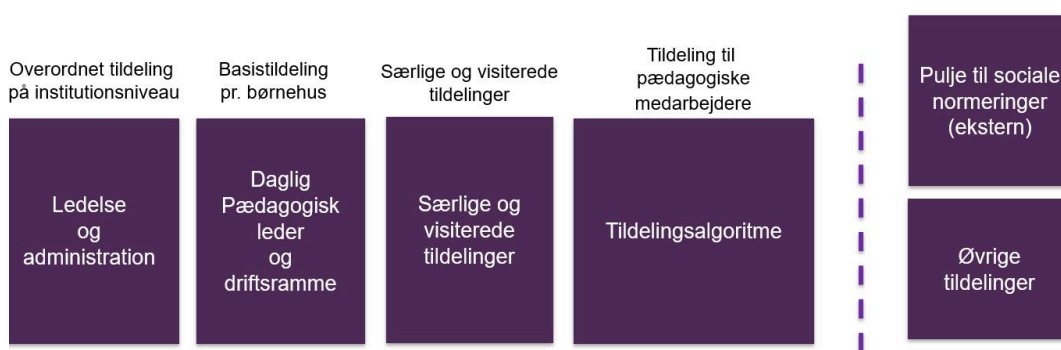
Figur 1: Tildeling til minimumsnormeringer på kommuneniveau via ny budgetmodel.

Udover budgetmodellen modtager institutionerne budgetmidler via den statslige pulje til sociale normeringer samt øvrige kommunale tildelinger. Figuren nedenfor skitserer principperne i den nye budgetmodel.