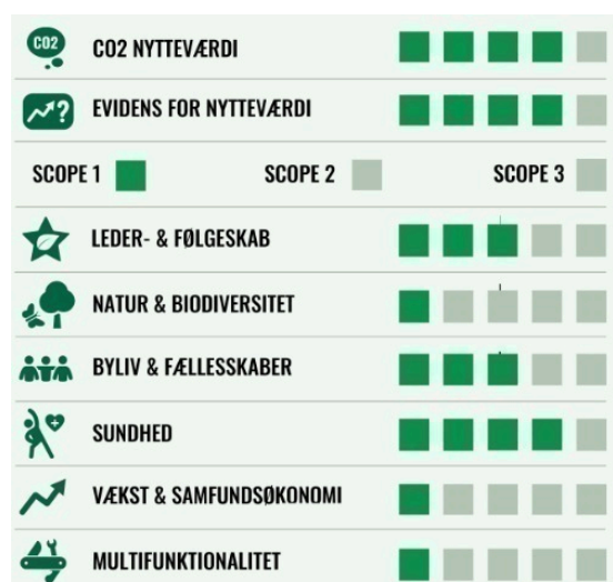
Billede: Nytteværdimodel for #2.8 Mere aktive og grønne transportvaner

Nytteværdien for #2.8 er høj i forhold til CO2 og Sundhed, mens den er mellem-høj for Leder- og følgeskab samt Byliv og fællesskaber.