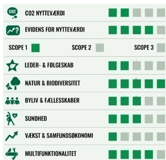
Billede: Nytteværdimodel for #3.1 Mere skov og natur i Odense

Nytteværdien for initiativ #3.1 er meget høj i forhold til Natur og biodiversitet, høj i forhold til Multifunktionalitet og mellem-høj i forhold til Sundhed samt Byliv og fællesskaber.