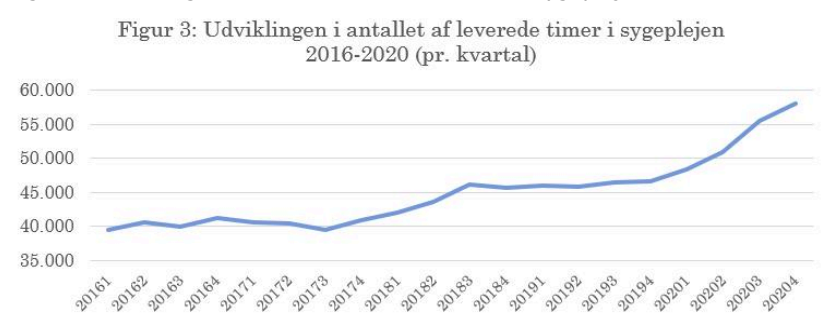
Figur 1: Udviklingen i antallet af leverede timer i sygeplejen

En lignende udvikling gør sig gældende på landsplan. En undersøgelse udført af Kommunernes Landsforening viser, at antallet af dage +80-årige i gennemsnit er indlagt på hospitalerne på landsplan er faldet med 27 procent. Faldet er større end for de øvrige aldersgrupper og betyder, at der nu stort set ikke er forskel på, hvor længe 65-79-årige og +80-årige er indlagt. Det øger kravene til kommunernes sygepleje, når de ældste udskrives tidligere.