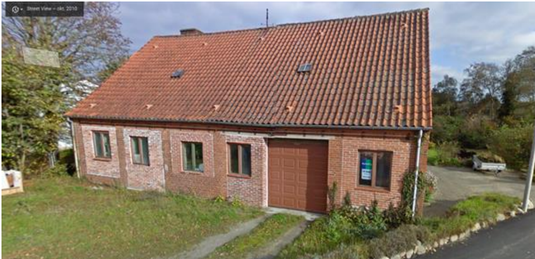
Billede af den bevaringsværdige bygning (Birkum Maskinværksted) fra Google Street fra 2010 - Den bevaringsværdige bygning ligger tættest på vejen: