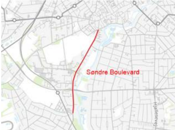
Kortudsnit over potentiel busbane på Søndre Boulevard.

Den estimerede anlægsudgift er 4,6 mio. kr. Den estimerede årlige afledte drift er 232.000 kr.