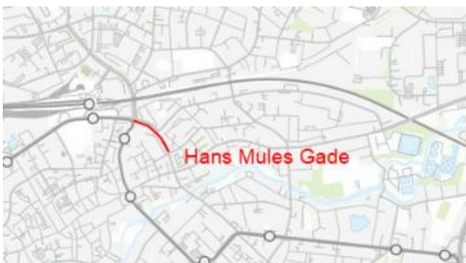
Kortudsnit over potentiel busbane på Hans Mules Gade.

Det præsenterede forslag drejer sig om busbane og signalprioritering i signalanlægget ved Hans Mules Gade/Østergade samt Hans Mules Gade/Thomas B. Thriges Gade i begge retninger.