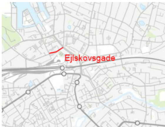
Kortudsnit over potentiel busgade på Ejlskovsgade.

Selskaber og beboere på strækningen vil forsat skulle have mulighed for at tilgå Ejlskovsgade fra deres matrikel. Den eksisterende trafik vil fremover skulle benytte Toldbodgade.