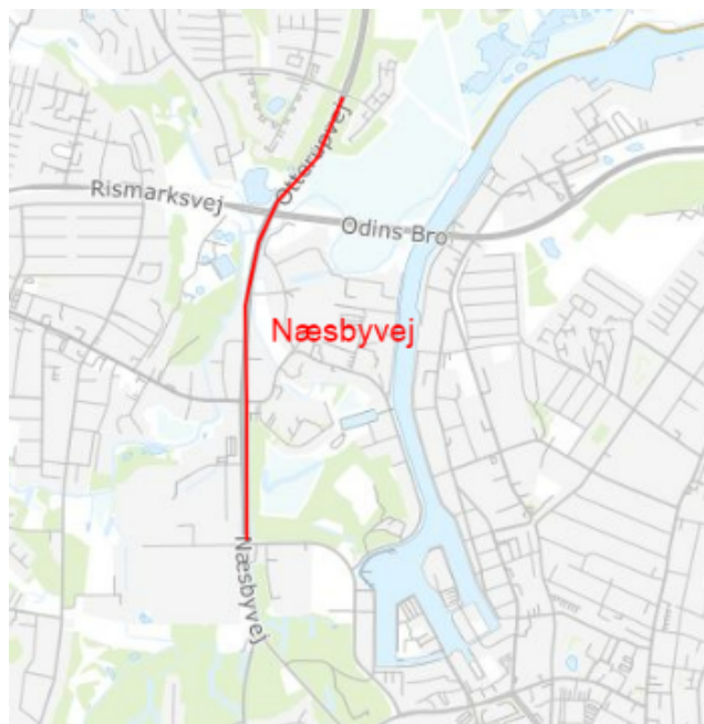
Kortudsnit over potentiel busbane på Næsbyvej.

Strækningen har ligeledes været nævnt i rådgivernes bud på en grøn mobilitetsplan for Odense, hvorfor strækningen vurderes relevant i denne sammenhæng.