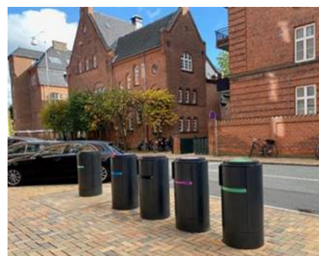
Foto som viser hvordan scenarie 3 kan se ud - eksemplet er fra Slotsvænget i Odense.

En række fordele og ulemper ved de tre scenarier er beskrevet nærmere i 3 bilag, som er vedlagt denne sag: