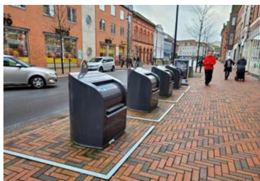
Foto som viser hvordan scenarie 2 kan se ud - eksemplet er fra Kolding.