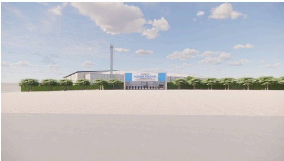
Visualisering af Odense Stadion set fra Højstrupvej. Richard Møller Nielsens Plads.