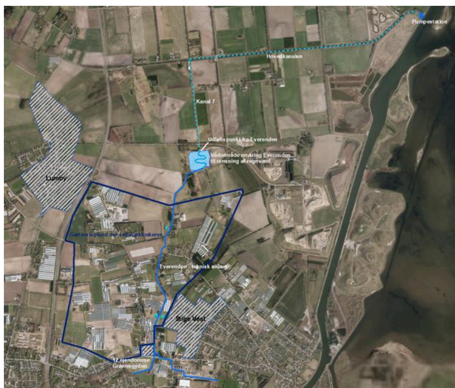
Figur 1: De kommende separatkloakerede områder ved Stige og Lumby er angivet med hvid skravering. Everenden er angivet med lyseblå streg fra syd for Haugevej og op til Strandløkkevej, hvor udløbspunktet for det spildevandstekniske anlæg til Kanal 7 ligger. Den mørkeblå afgrænsning viser området med gartnerier, som også ønskes separatkloakeret.

Med dette tillæg til spildevandsplanen foreslås Everenden optaget i spildevandsplanen som et spildevandsteknisk anlæg fra dens udspring syd for Haugevej og frem til dens udløb i Kanal 9 ved Strandløkkevej, jf. nedenstående figur 1. Herved bliver det VandCenter Syd, som fremover kommer til at eje, drive og vedligeholde renden på denne strækning.