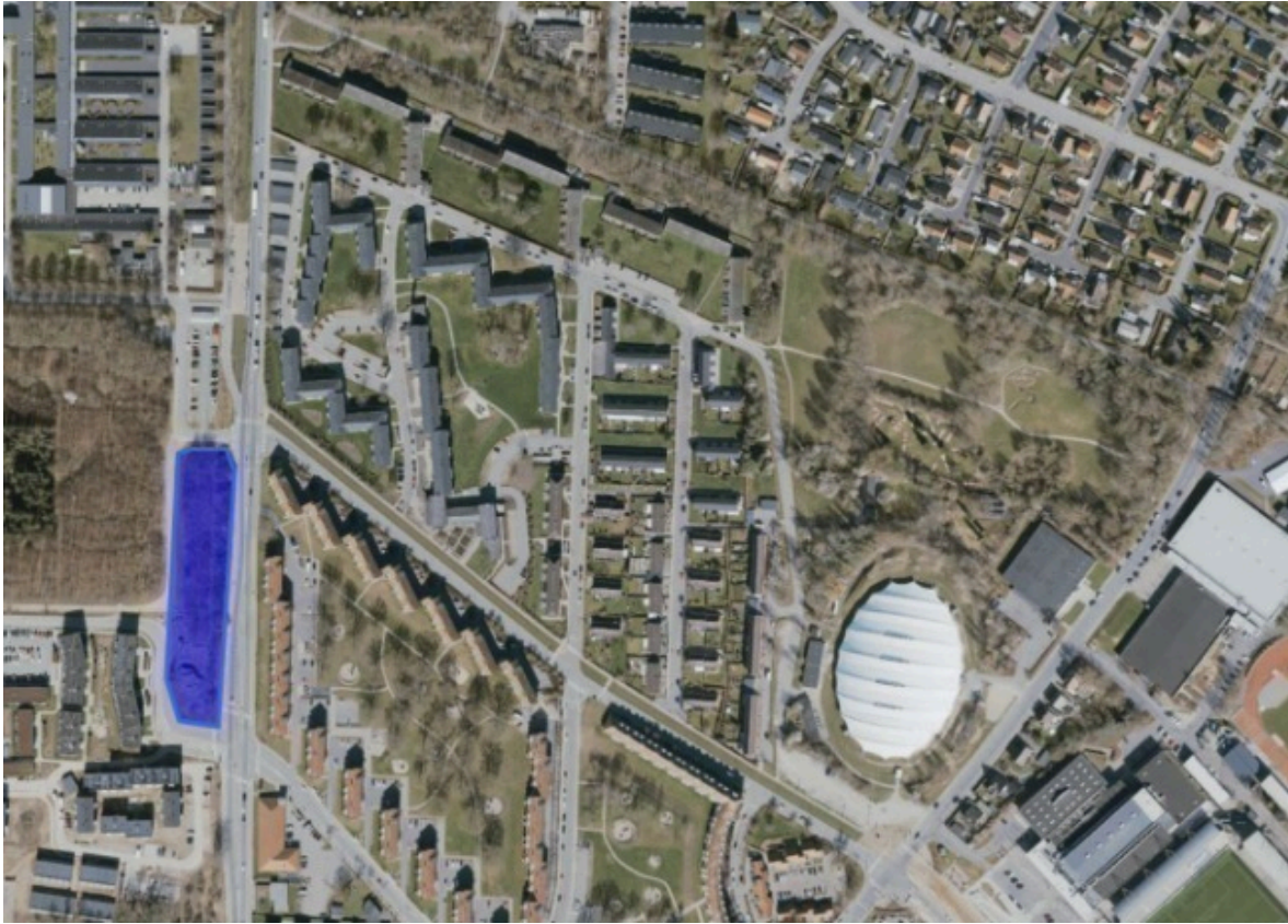
Kortudsnit, der viser matrikelskel og de to delarealer