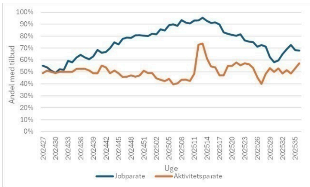
Figur 1: Andel af ukrainske flygtninge på SHO-ydelse, der modtager tilbud efter beskæftigelses- eller integrationsloven

Figur 2 viser, at de jobparate ukrainere fra starten af 2025 og frem til juni 2025 i gennemsnit havde 20-25 timers aktivitet ugentligt. Det lavere timetal fra slutningen af juni til starten af august skyldes samme årsager som nævnt i bemærkningerne til figur 1. For de aktivitetsparate varierer det gennemsnitlige timetal mellem 5 og 12 timer ugentligt.