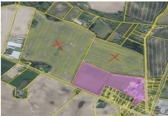
Illustration af areal på Bogensevej 465.

Det tredje alternativ er et areal beliggende på Bogensevej 465, Odense N.