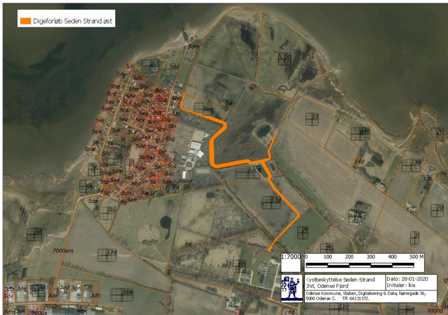
Figur 1: Digets forløb øst om Seden Strandby

Den kombinerede indsats for forbedring af natur og tilpasning til klimaforandringer sker også som del af Natura 2000-handleplanen for Odense Fjord 2016-2021, som Odense Kommune er forpligtet til at gennemføre. Handleplanen er godkendt af Odense Byråd den 19. april 2017.