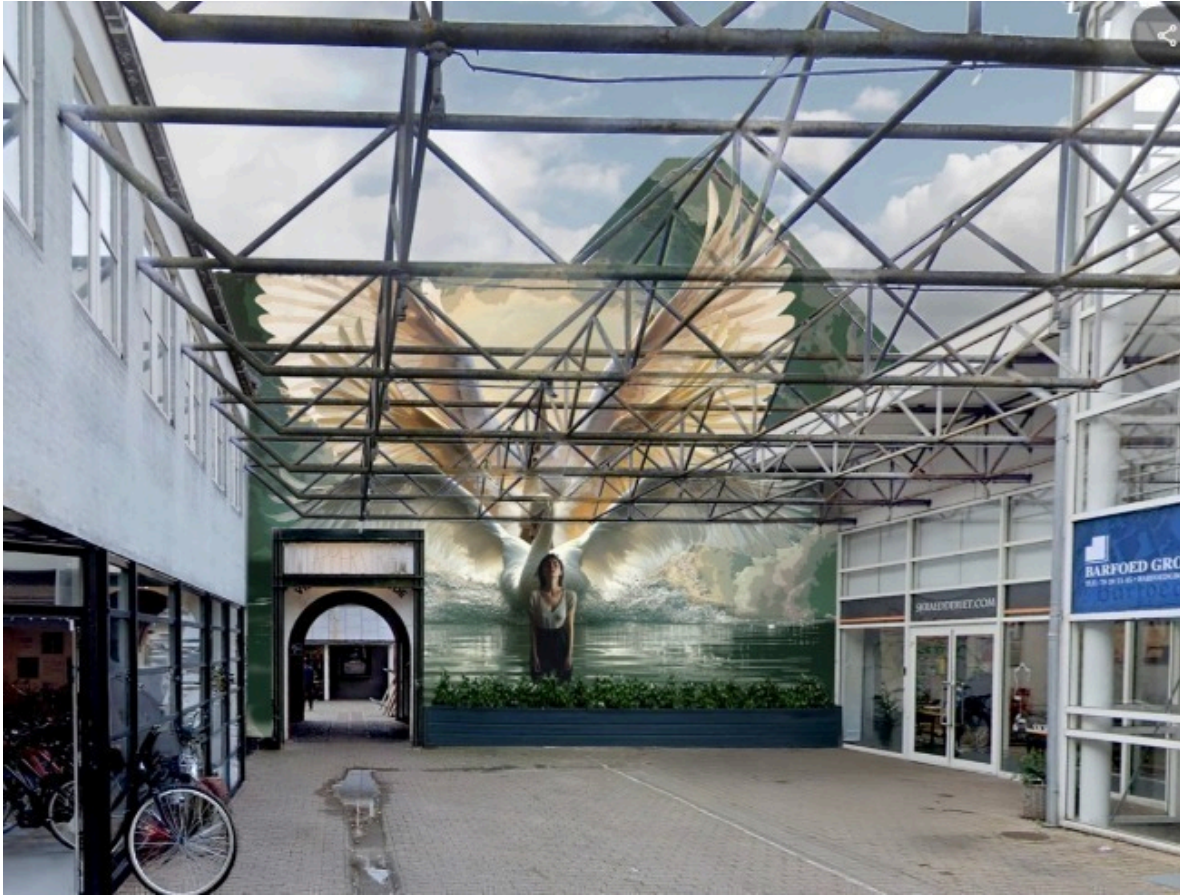
Herunder ses en visualisering af værket uden overdækningen.