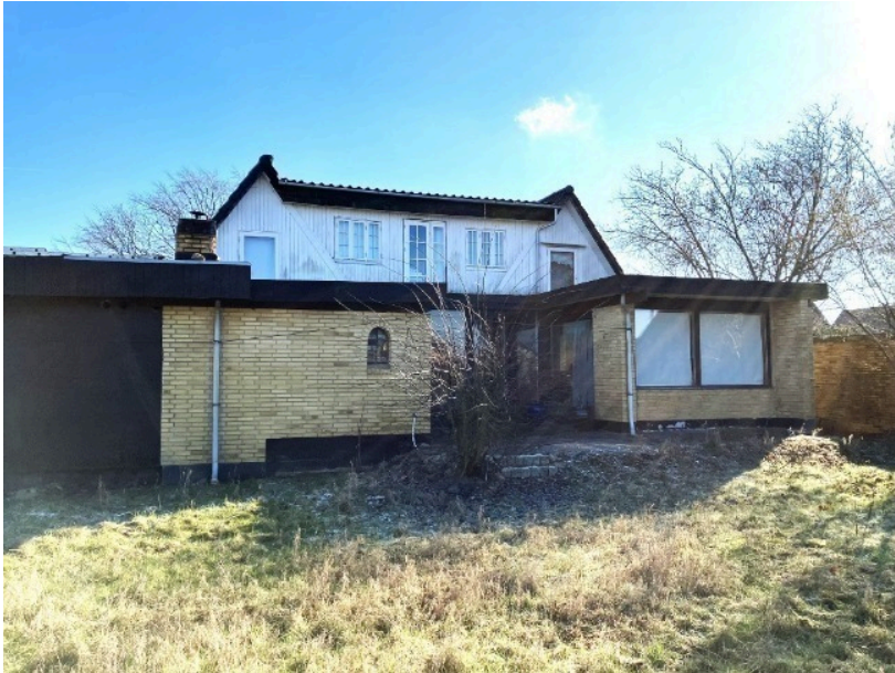
Herunder ses mødet mellem den oprindelige villa og den ene tilbygning fra 1976.