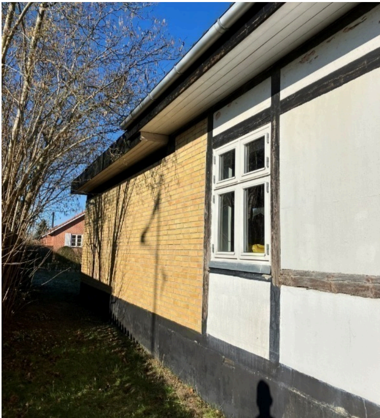
Herunder ses hvordan det nederste af villaens oprindelige bindingsværk flere steder er erstattet af beton – med råd i stolperne til følge.