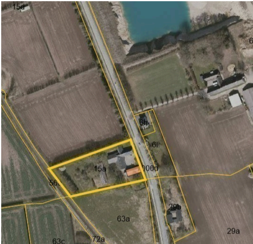
Herunder ses ejendommen på luftfoto.