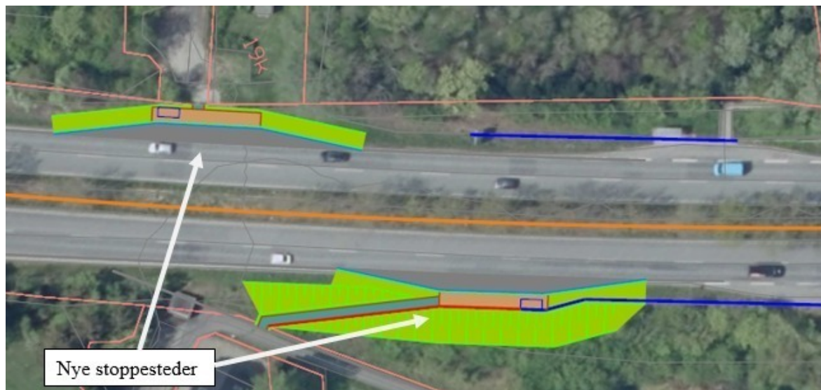
Figur 1: Otterupvej ved Slettensvej. Ny busstoppesteder 80 meter længere mod syd. Der etableres samtidig hegn i midterrabbatten (orange linje) og ved de eksisterende stoppesteder etableres der autoværn (blå linjer).

Dette vil sikre adgang til den regionale busrute som erstatning for lukningen af bybuslinjen mellem Lumby og Odense Banegårdscenter.