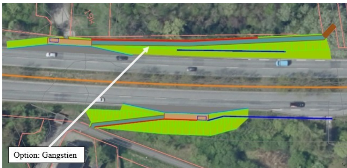
Figur 2: Otterupvej ved Slettensvej. Figuren viser placering af gangstien i vestlig side.

Udvalget skal med denne sag tage stilling til om etablering af en gangsti, da dette er en option. Projektet kan løses inden for den eksisterende ramme på 2,5 mio. kr. Godkendes etableringen af gangstien ændres formålet imidlertid med bevillingen, hvilket medfører en merudgift på 0,5 mio. kr. Anlægsrammen øges dermed til 3,0 mio. kr.