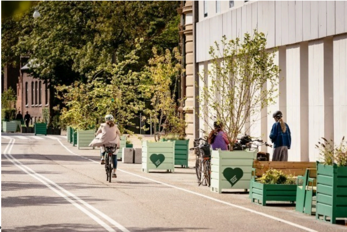
Billede 2: Billede af nuværende delstrækning i Slotsgade foran Det Fynske Kunstakademi.