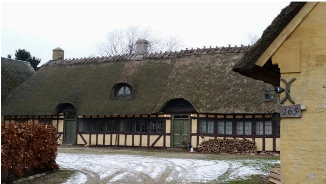
Udhyslænge mod gårdrummet (vest):