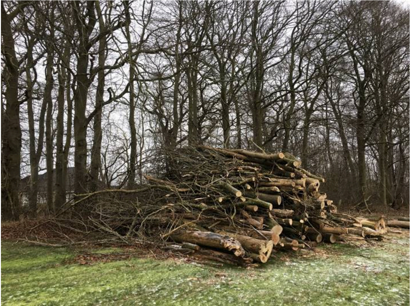
Skoven set vest (Myntevej)