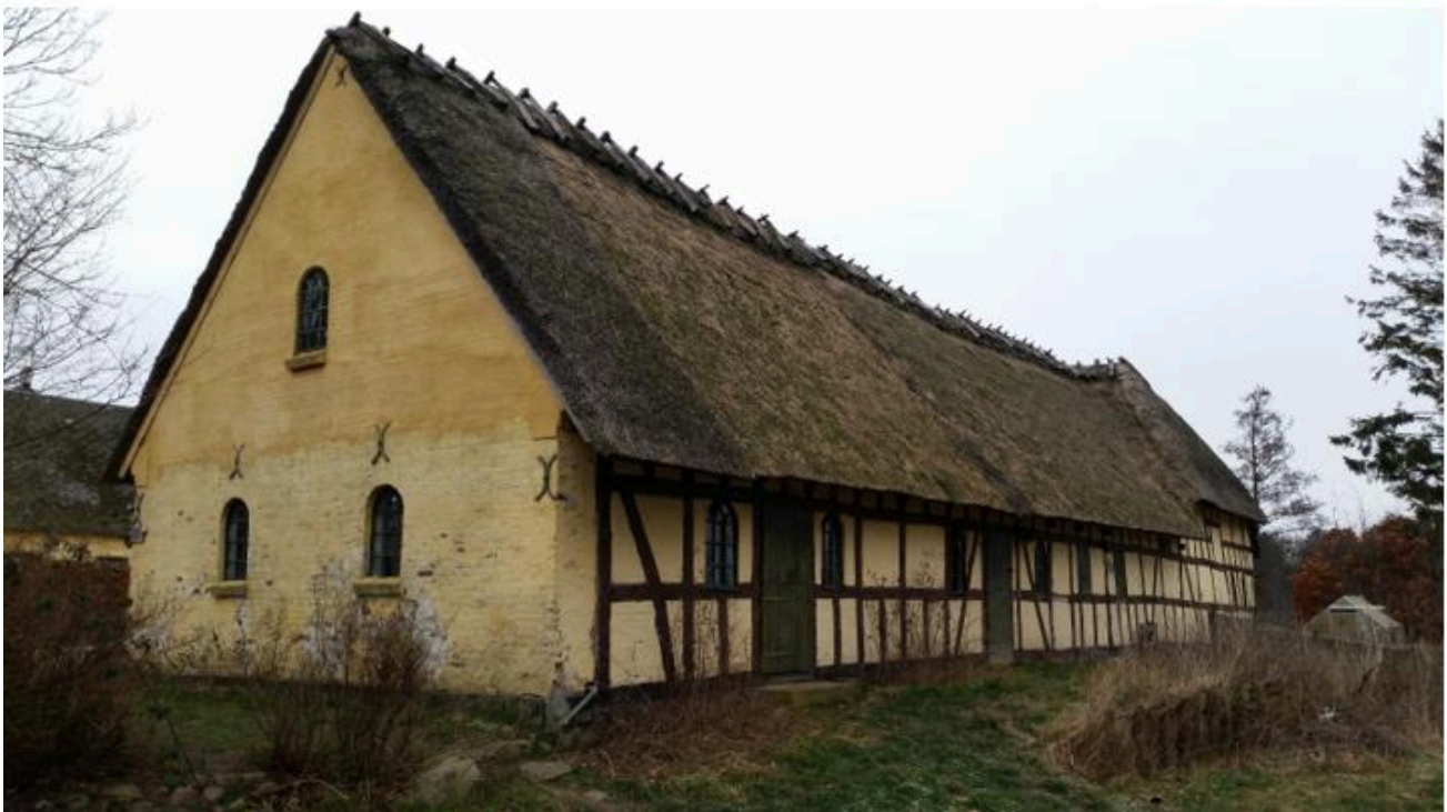
Den tredje længe samt del af boligen: