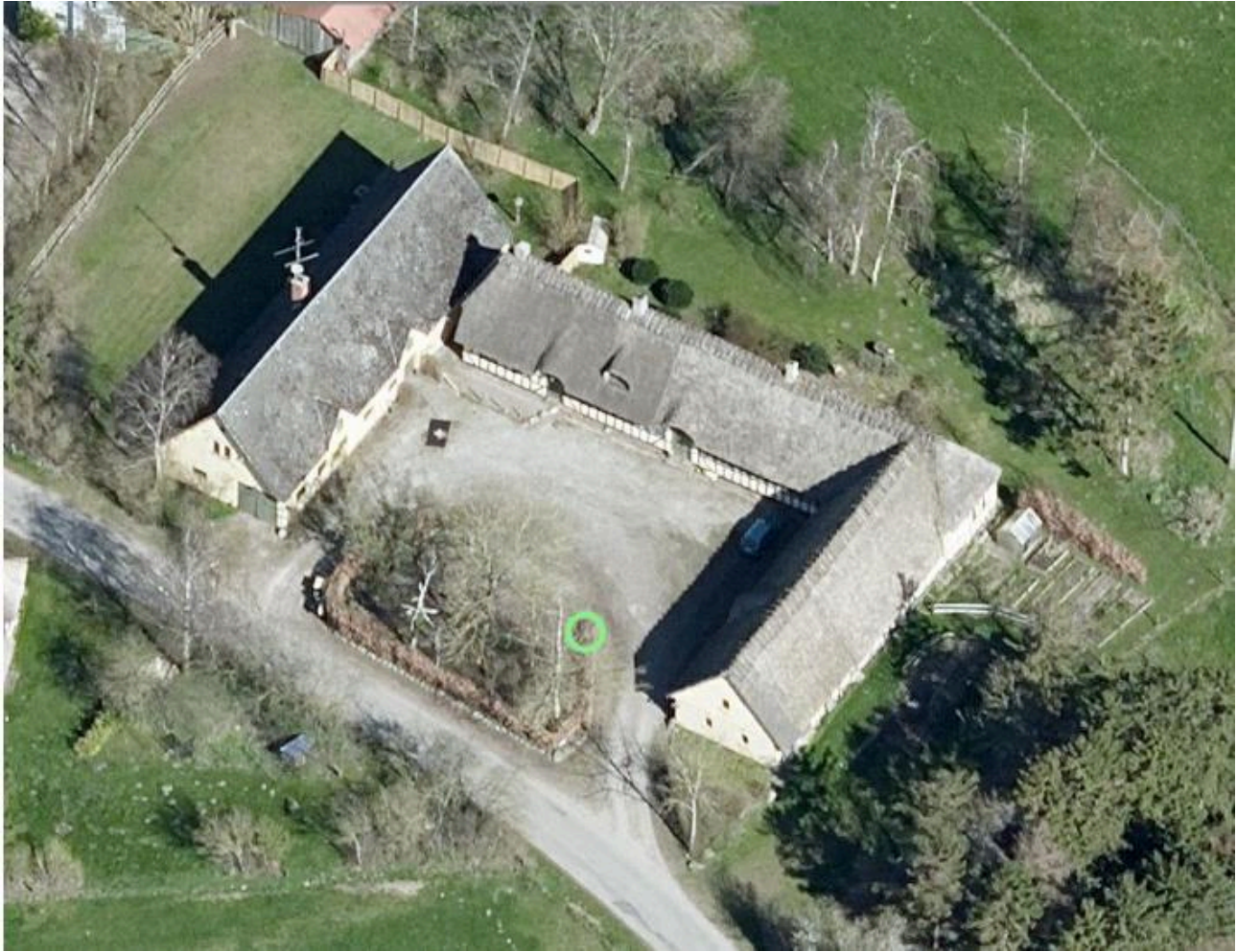
Boligens facade mod syd: