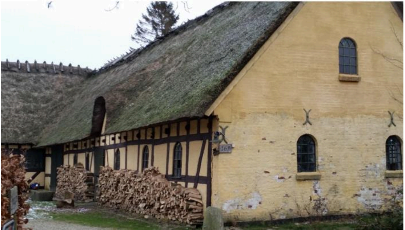
Udhus længe mod øst: