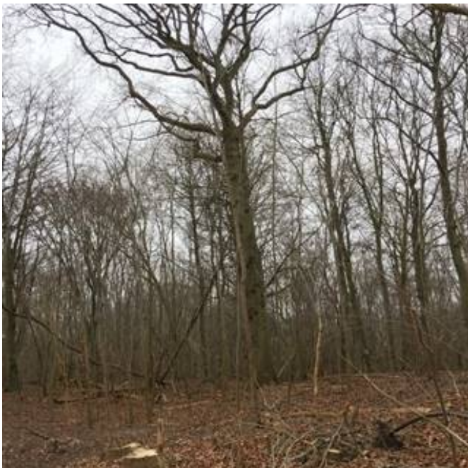
Et af flere markante egetræer