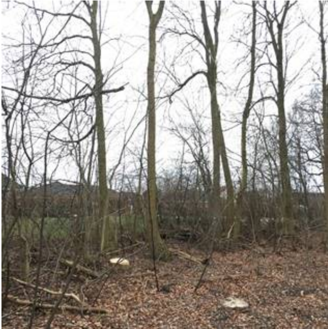
Skoven set mod øst i område, der er delvist ryddet

Ejeren igangsatte arbejdet med fældning og beskæring af skoven i efteråret 2018. Forvaltningen blev opmærksom herpå på baggrund af en nabos henvendelse herom i slutningen af november 2018. I den forbindelse oplyste forvaltningen, at arbejdet krævede dispensation fra lokalplan 10-582, afsnit 9.2.