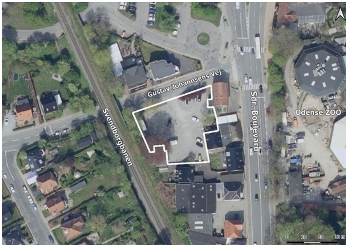
Planområdet – markeret med hvidt.

Øst for planområdet løber en indfaldsvej mod byens centrum, hvor der på den anden side ligger boliger og Odense Zoo. Syd for planområdet ligger enkelte boliger.