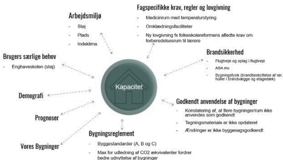
Figur 1: Udfordringer og påvirkninger på Odense Kommunes bygningsmasse

Odense Kommune oplever flere forudsigelige udfordringer med bygningsmassen i forhold til kapacitet, arbejdsmiljø og påbud. Det er Arbejdstilsynet, brandinspektion og sundhedsmyndighederne, der udsteder påbud. Som figur 1 illustrerer, er dette blot nogle af de ting som påvirker bygningsmassen og udfordrer kapaciteten. Løsninger er som problemet alsidige og kan handle om både adfærd, organisering, men også de fysiske rammer. Det afhænger af det enkelte konkrete problem, det enkelte konkrete sted.