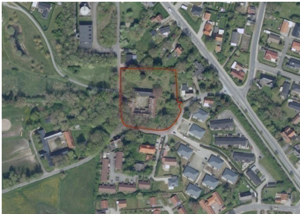
Luftfoto af lokalplanens område (markeret med rød).

Nærområdet har overordnet et meget grønt præg, og der findes flere store træer inden for lokalplanens område, som vist på nedenstående luftfoto.