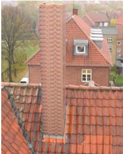
Nuværende radome 65x65x250cm