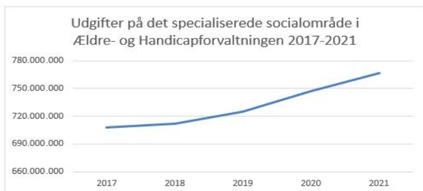
Tabel - Udviklingen i udgifter på det specialiserede socialområde 2017-2021

Forvaltningen bemærker også, at Odense Kommune er en af de kommuner i Danmark med færrest udgifter pr. 18-66 årig på voksenhandicapområdet. Derudover forventer Borgmesterforvaltningen ikke, at området vil blive tildelt midler i de kommende års økonomiaftaler mellem regeringen og KL.