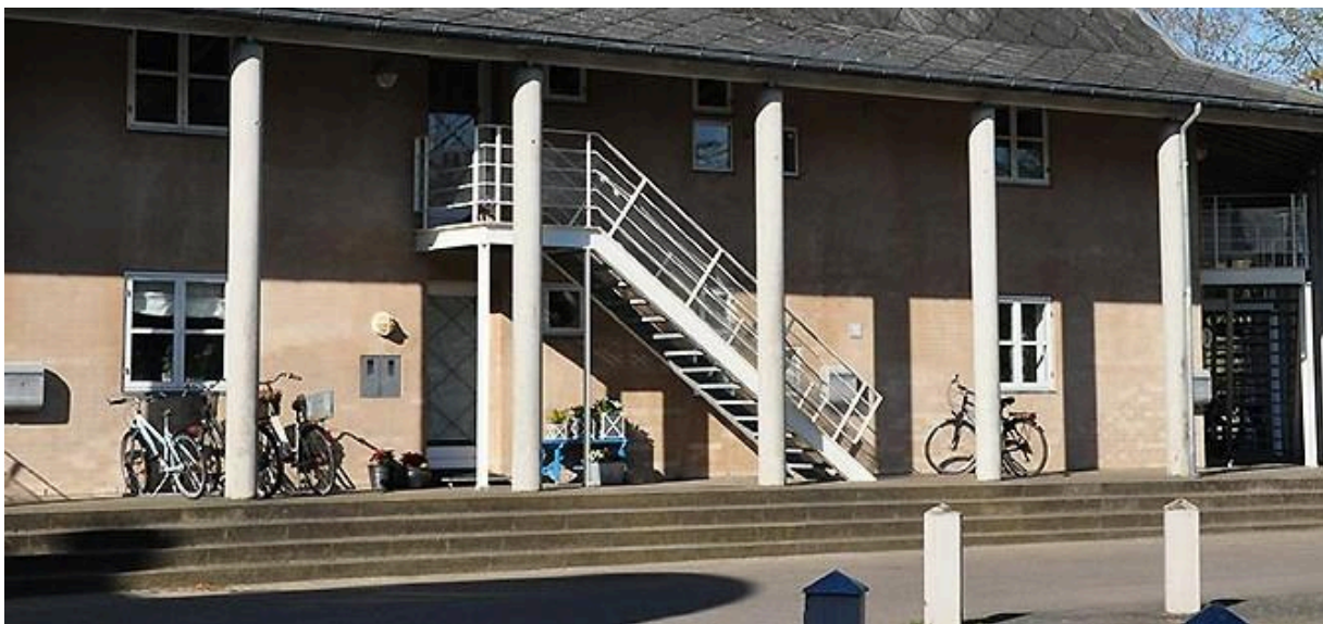
Det lysebrune hus

Blommegrenen og Stammen er udført med en gul/brun facadepudset ydervæg med diagonalskifre på taget. Taget er udført med et stort udhæng/halvtæg, der overdækker den udvendige trappe til 1. sal, udhænget er understøttet af tæt placerede betonsøjler, der giver bygningen et græsk/romersk udtryk. Lejlighederne på 1. salen er udført i 2 plan med udnyttet tagetage.