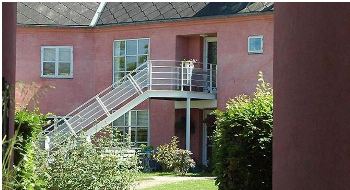
Det lyserøde hus

Pæregrenen er udført med rosa farvet facadepudset ydervæg og med diagonalskifre på taget. Den udvendige trappe i det fri fører til lejlighederne på 1. salen, som er udført i 2 plan med udnyttet tagetage.