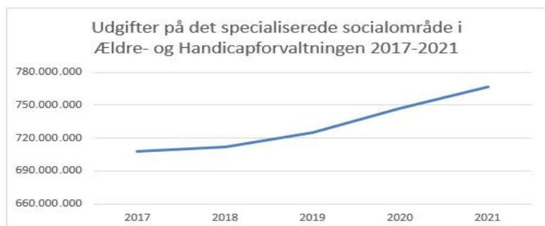
Tabel - Udviklingen i udgifter på det specialiserede socialområde 2017-2021

Forvaltningen bemærker også, at Odense Kommune er en af de kommuner i Danmark med færrest udgifter pr. 18-66 årig på