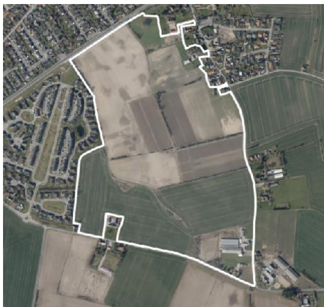
Figur 1: Området i Skt. Klemens som udlægges som separatkloakeret opland.

Området, som er omfattet af tillæg til spildevandsplanen, fremgår af nedenstående figur.