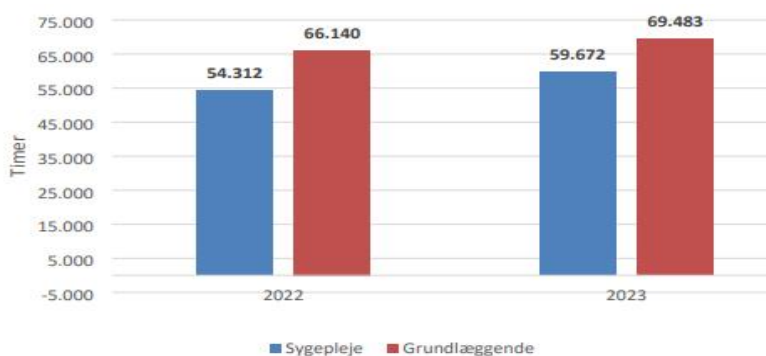
Figur - Antal leverede timers sygepleje og grundlæggende sygepleje, 2022-2023

Ved grundlæggende sygeplejeopgaver forstås opgaver, som er relaterede til en stabil, ukompliceret situation. Situationen forandrer sig langsomt og som forventet. Opgaven kan udføres af personer, der er i stand til selvstændigt at udføre den grundlæggende sygepleje. Det vil sige bedømme, tilrettelægge og iværksætte et stabilt plejeforløb.