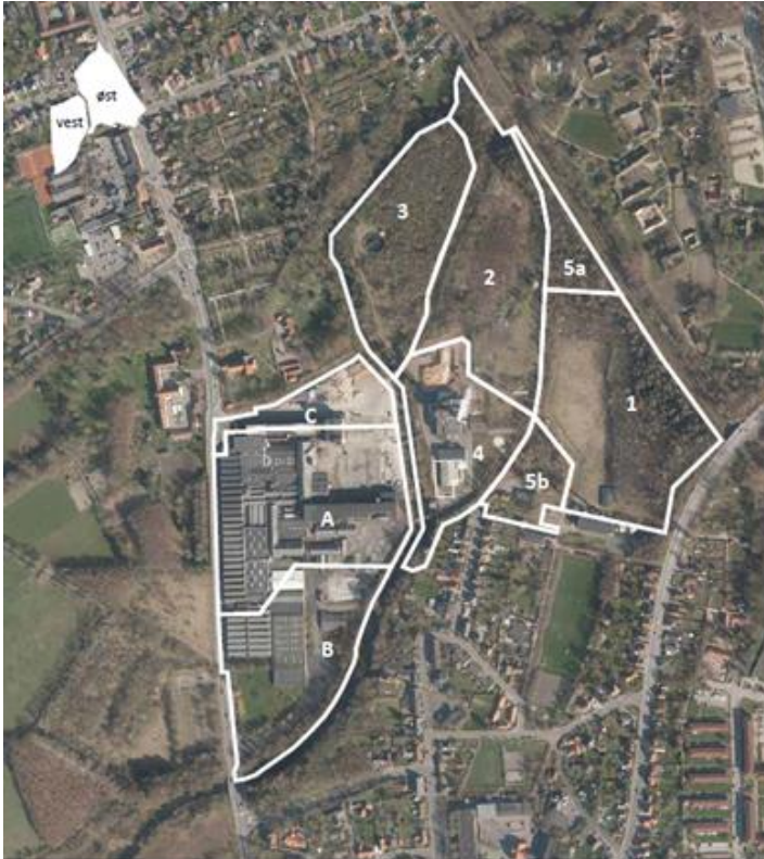
Figur 1: Dalum Papirfabrik opdelt i områderne A-C (vest for Odense Å) og områderne 1-5b (øst for Odense Å)