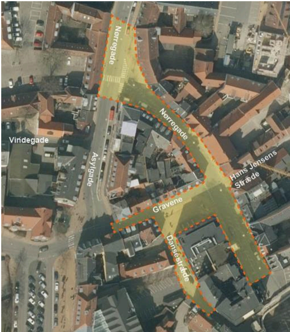
Projektområde for renovering af Nørregade syd, Gravene og Dansestræde