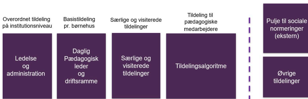
Figur 1: Tildeling til minimumsnormeringer på kommuneniveau via ny budgetmodel.

Udover budgetmodellen modtager institutionerne budgetmidler via den statslige pulje til sociale normeringer samt øvrige kommunale tildelinger. Figuren nedenfor skitserer principperne i den nye budgetmodel.