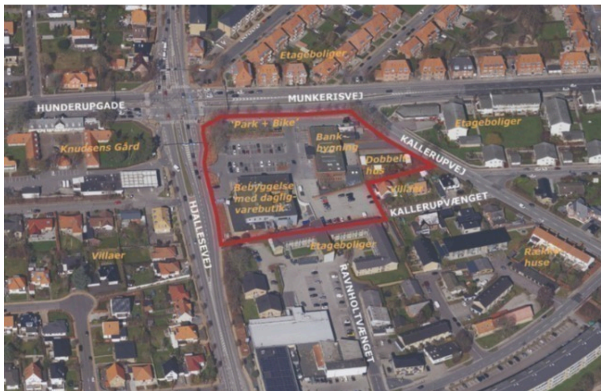
Luftfoto med afgrænsning af lokalplanområdet.

Nærområdet er karakteriseret af bebyggelse fra 1930'erne, 1940'erne og 1950'erne, hvor bebyggelse fra 1950'erne udgør hovedparten af bygningsmassen. Dertil udgør 'Knudsens Gård' på modsatte side af Hjallesevej ud for lokalplanområdet en vigtig historisk reference i nærområdet. Se afgrænsning af planområdet nedenfor.