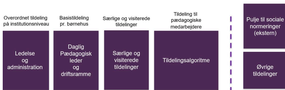
Figur 1: Tildeling til minimumsnormeringer på kommuneniveau via ny budgetmodel.

Udover budgetmodellen modtager institutionerne budgetmidler via den statslige pulje til sociale normeringer samt øvrige tildelinger. Figuren nedenfor skitserer principperne i den nye budgetmodel, samt de budgetmidler der ligger udenfor modellen.