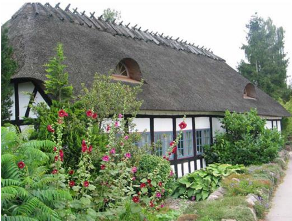
Hovedhuset Brogårdsvej 16

By- og Kulturforvaltningen har den 10/8 2016 modtaget lignende henvendelse fra ejeren af Brogårdsvej 24F, hvis firelængede gård ligeledes er omfattet af bevaringsbestemmelser i lokalplan 6-666.