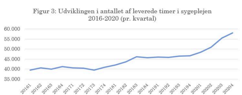
Figur 1: Udviklingen i antallet af leverede timer i sygeplejen

En lignende udvikling gør sig gældende på landsplan. En undersøgelse udført af Kommunernes Landsforening viser, at antallet af dage +80-årige i gennemsnit er indlagt på hospitalerne på landsplan er faldet med 27 procent. Faldet er større end for de øvrige aldersgrupper og betyder, at der nu stort set ikke er forskel på, hvor længe 65-79-årige og +80-årige er indlagt. Det øger kravene til kommunernes sygepleje, når de ældste udskrives tidligere.