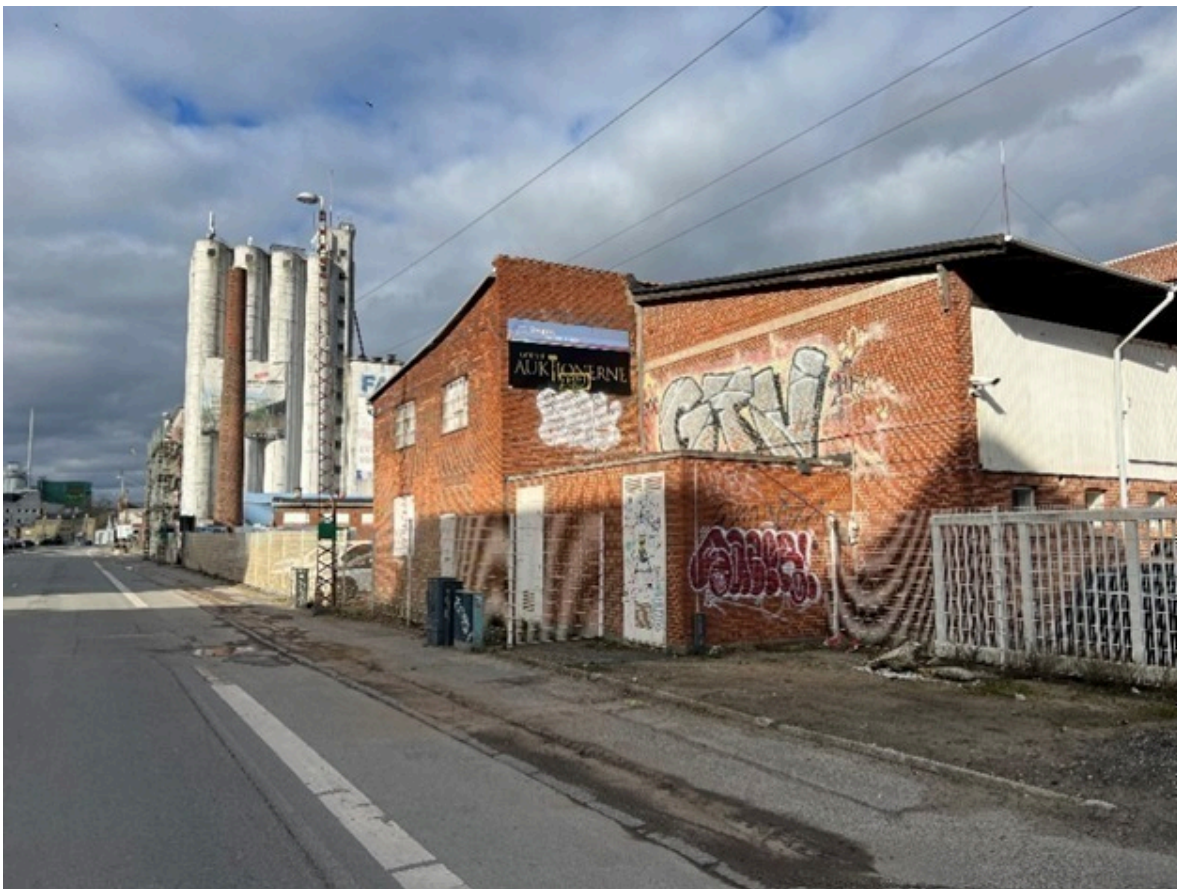
Fotoet nedenunder viser blik mod vest gennem Malmøgade. Det lave byggeri fremstår tydeligt, med skorstenen som markør. De nye bygninger på Havnegades vestside indrammer blikket til siloøen yderligere.