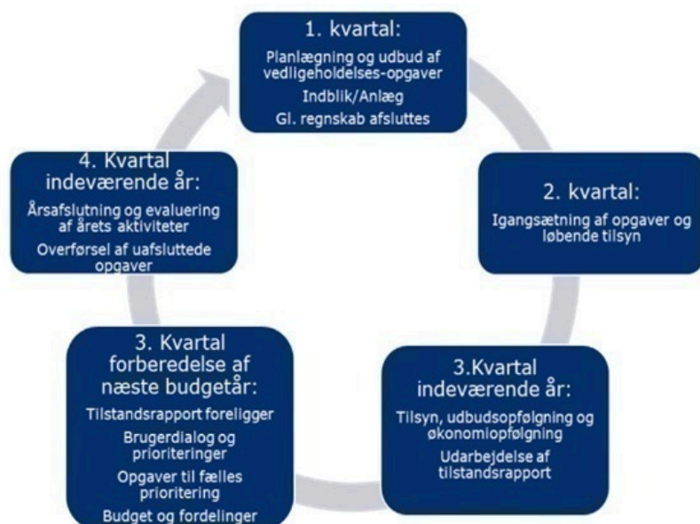
Billede 1: Beskrivelse af årshjul for arbejdet med vedligeholdelsesplaner, tilstandsvurderinger og budgetlægning.

I fjerde kvartal evalueres og afsluttes året og uafsluttede opgaver overføres til næste år. Der vil også være opgavetyper, der løber over flere år.