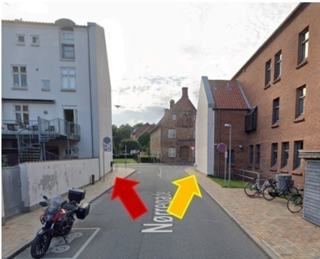
Herunder ses gavlen på ejendommen, Skulkenborg 1.