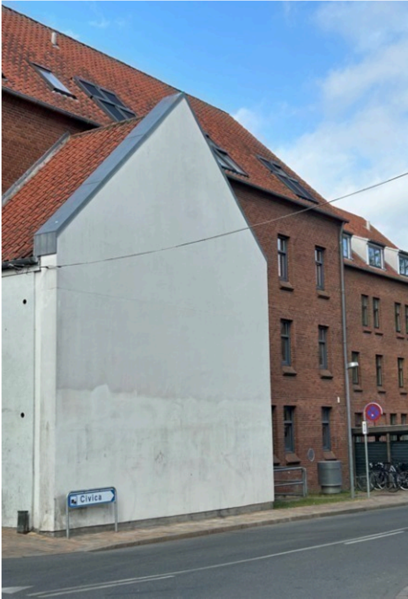
Herunder ses en visualisering af gavlen med værket.