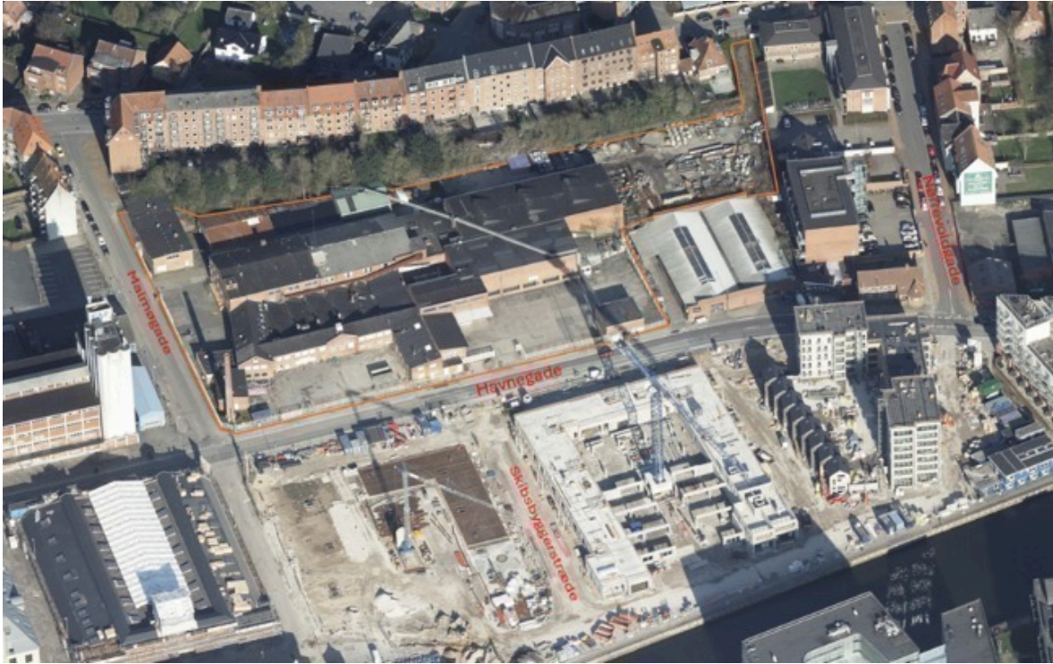
Fotoet nedenunder viser blik mod nord gennem Havnegade med varierende skalaer og det knopskudte byggeri. Konservesfabrikkens skorsten syner ikke af meget, med siloerne som baggrund.