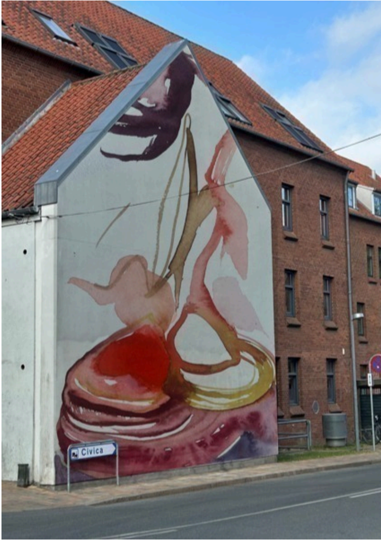
Herunder ses gavlen på ejendommen, Nørregade 51.