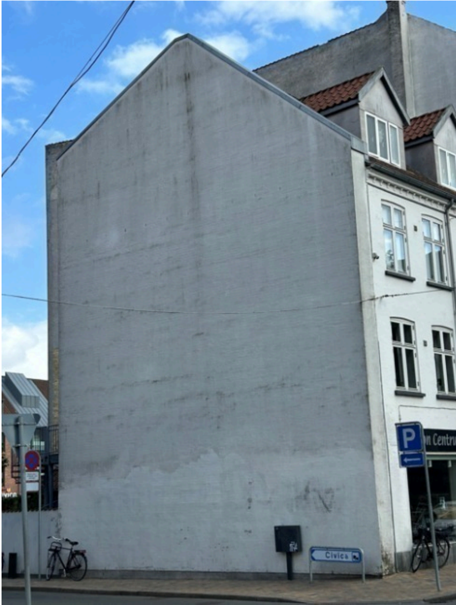
Herunder ses en visualisering af værket.