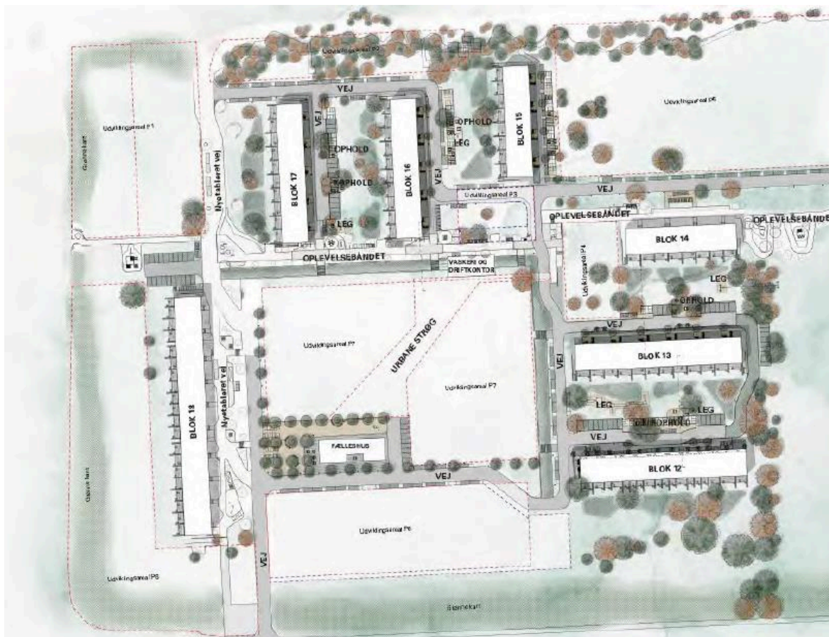
Granparken, fremtidige forhold.

Tilgængelighedsboligerne indrettes med større badeværelser, køkkener og minimum ét soveværelse indrettes med plads til en dobbeltseng. Afdelingen fremtidssikres derved med attraktive og tidssvarende boliger fra den moderne familiebolig, seniorbolig, eller mulighed for at blive i eget hjem ved fx en funktionsnedsættelse med behov for ekstra plads til, at en selvhjulpne kørestolsbruger kan komme ind og rundt i boligen.