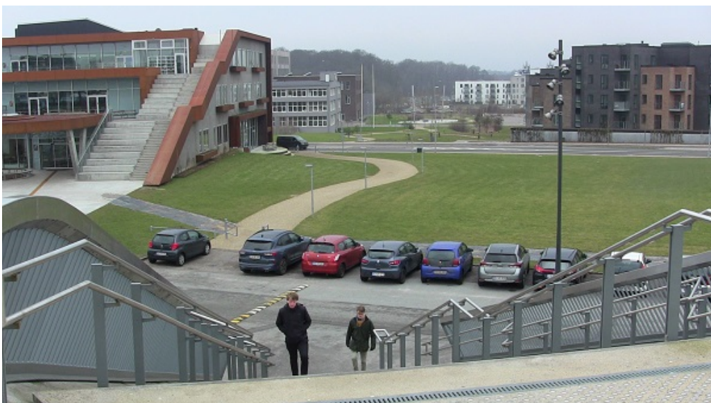
Kottesgade set fra Byens Bro med den grønne kile i baggrunden