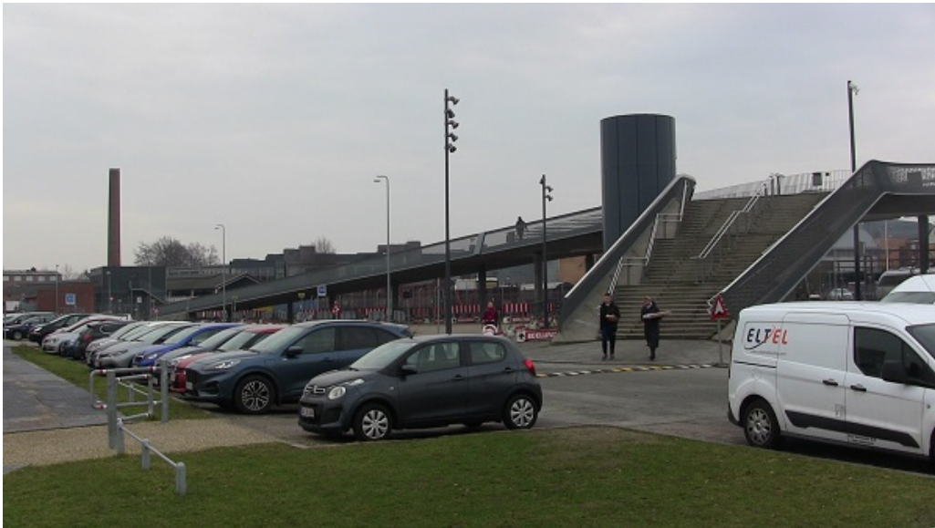
Kottesgade set fra HF Fyn

Et nyt byrum i Kottesgade kan blive et velkomstrum til Odense. Med et stigende fokus på klimavenlig mobilitet forventer Odense Kommune et øget antal passagerer til og fra Odense Banegård og dermed blandt andet et øget behov for cykelparkering. Byrumsudviklingen sker i dialog med HF & VUC Fyn, DSB, jernbanemuseet og VandCenter Syd. Øvrige relevante interessenter vil blive involveret undervejs.