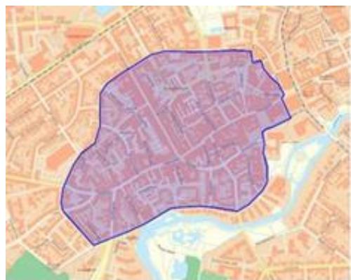
Fig. 1 Afgrænsning af forsøgsområde

Arealet omkranset med blå linje viser det område, som pilotprojektet dækker over. Det udgør området, hvor de udkørende hjemmeplejere oplever de største udfordringer med parkering.