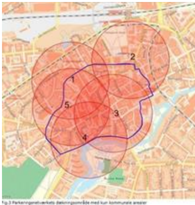
Fig.3 Parkeringsnetværkets betryngsområde med kun kommunale arealer

Beskrivelse af de fem kommunale arealer, som indgår i parkeringsnetværket