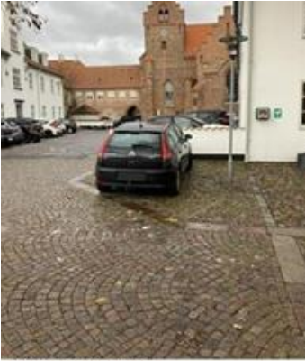
Fig.5 parkering bag Somme i udsamlingsområdet