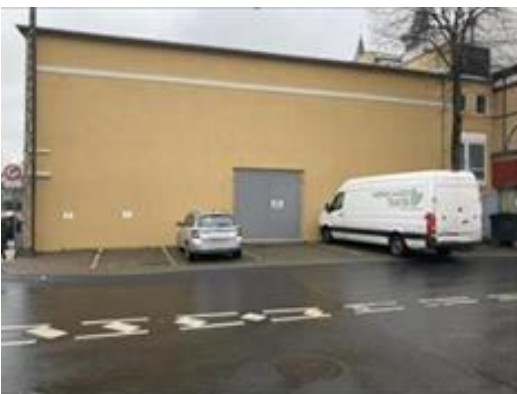
Fig.7 Parkering bag teater på Filosofhaven

Det kan via skiltning sikres, at det kun er aften og nat pladsen er inddraget, således almindelig parkering stadig kan foretages i dagtimerne.