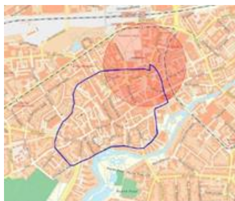
Fig. 2 Princip for parkeringsnetværk, hvor hver plads dækker en radius af 300 meter

Selve parkeringsnetværket vil bestå af flere parkeringspladser på forskellige steder. Hver enkelt plads skal dække over sit eget lokalområde i en radius af 300 meter. Det skulle gerne sikre, at den samlede gang fra parkeringspladsen ikke overstiger 500 meter. På kortet herunder er princippet for de enkelte parkeringspladsers dækningsområde vist.