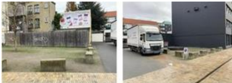
Fig.8 Byggefeltet i Grønnegade omkranset af betonklodser

Da arealerne er lokalplanlagt til boligbebyggelse, og forventes udbudt til salg i 2023, er der derfor tale om midlertidig anvendelse til pilotprojektet, idet salg påregnes effektueret ultimo 2023.