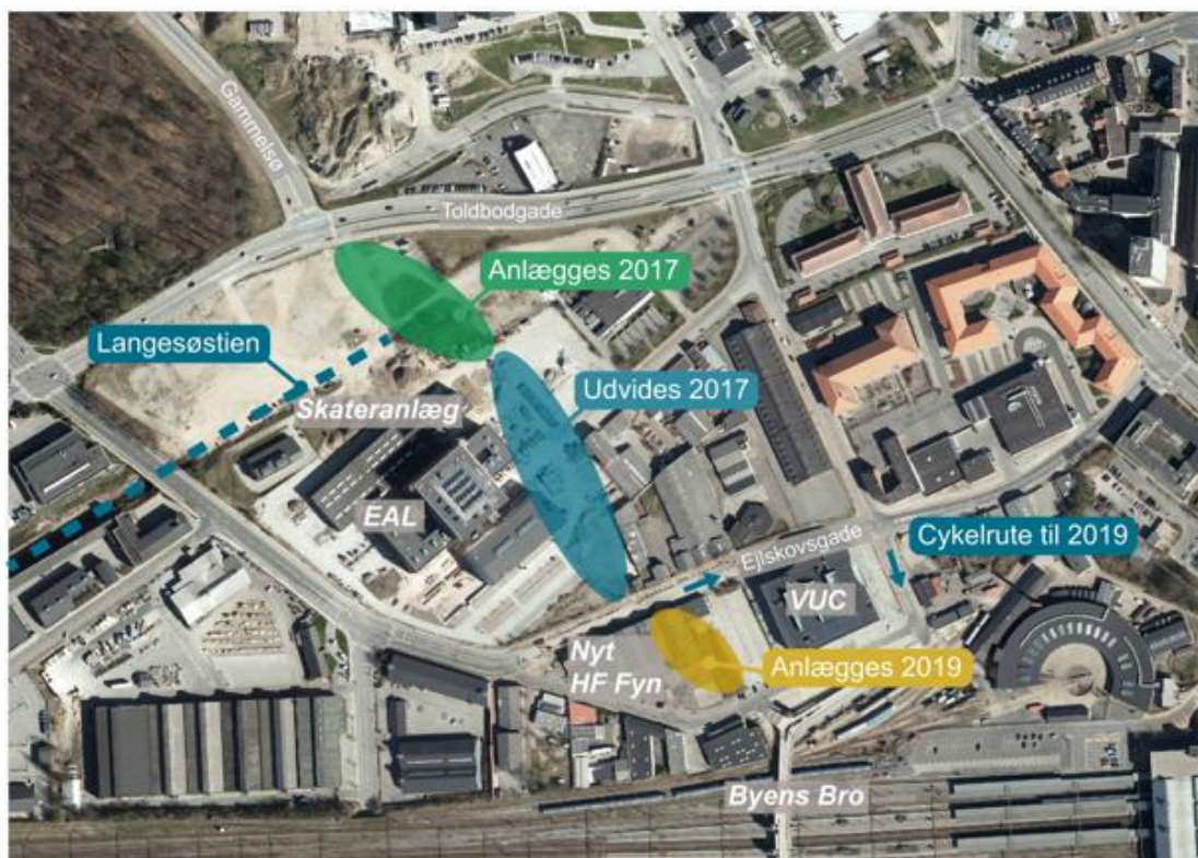
Oversigtskort med markering af stiens 3 delforløb

Frem til 2019, hvor HF og VUC Fyn anlægger den sidste del af stien, kan cyklister og fodgængere anvende Ejlskovsgade, Lerchesgade og Kottesgade.