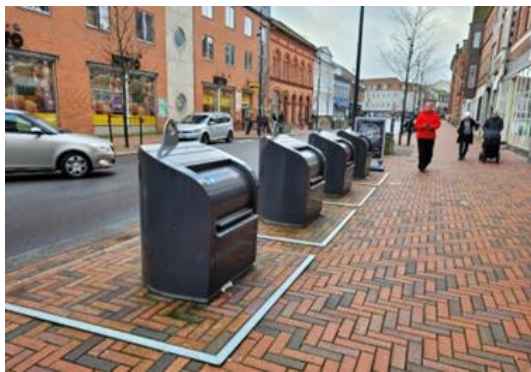
Foto som viser hvordan scenarie 2 kan se ud - eksemplet er fra Kolding.