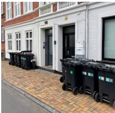
Nuværende forhold - Vestre Stationsvej