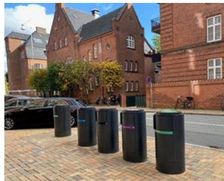
Foto som viser hvordan scenarie 3 kan se ud - eksemplet er fra Slotsvænget i Odense.

En række fordele og ulemper ved de tre scenarier er beskrevet nærmere i 3 bilag, som er vedlagt denne sag: