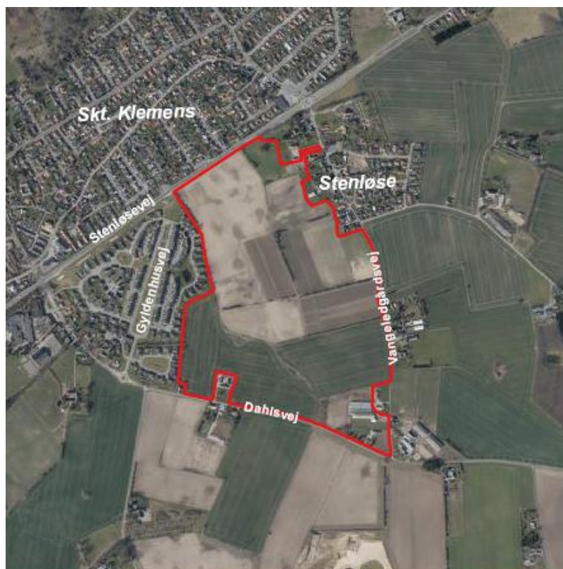
Oversigtskort med planområdet (afgrænset med rødt)

Lokalplanen fastlægger krav til bygningshøjde og -udformning, materialekarakterer og belægningstyper, som understøtter projektets signaturværdi som naturintegreret bebyggelse og som forgangseksempel med mindre grunde til parcelhuse. Lokalplanens krav til byggeriet og områdets udformning detaljeres yderligere i kravspecifikationer ved udbud af grunde i området.