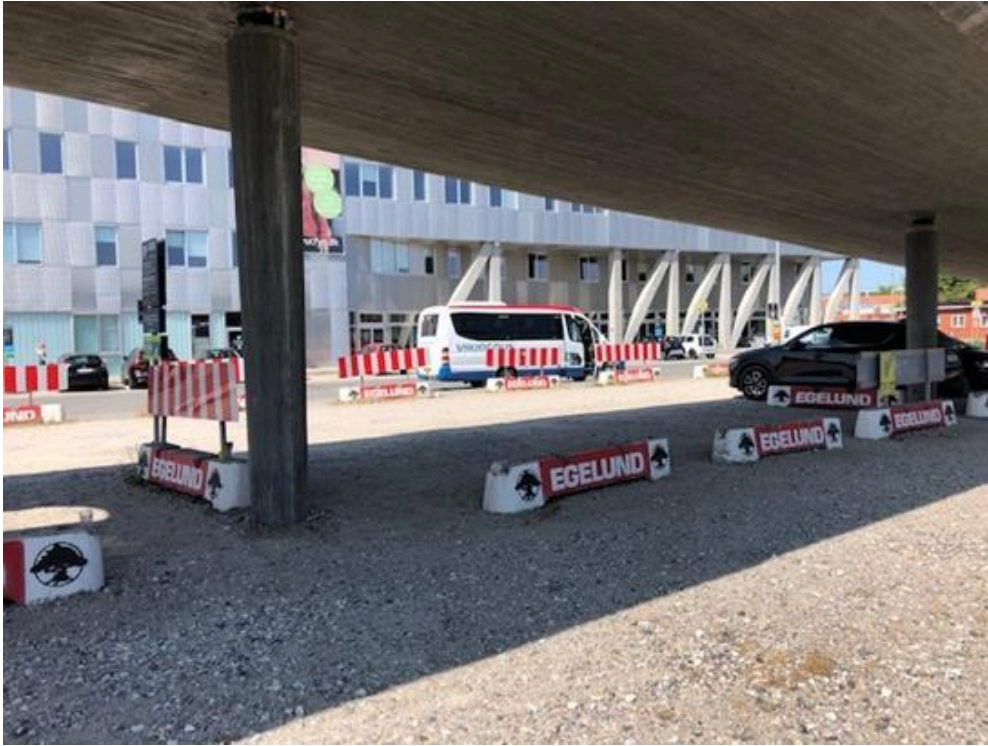
Billede 2 - Kottesgade set fra under Byens Bro mod VUC.