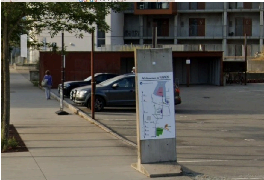
Illustrationer af kunstværkernes placering på Indre Havn og den nuværende skiltning på havnen.