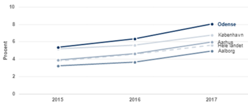
Figur 1: Andelen af fattige børn i 4-byerne

Note: Børn defineres som værende personer under 18 år. Kilde: Danmarks Statistik (INDFORD) og egne beregninger