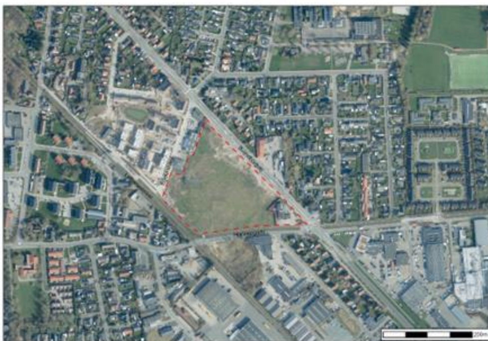
Luftfoto af lokalplanområdet (markeret med rød streg)

By- og Kulturudvalget har den 26. oktober 2021 givet foreløbigt tilsagn om grundkapital til de almene boliger.