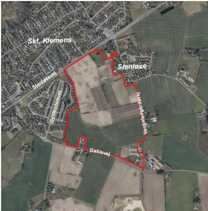
Oversigtskort med planområdet (afgrænset med rødt)

Lokalplanen er ikke i overensstemmelse med kommuneplanen, hvorfor der samtidig med lokalplanen er udarbejdet et kommuneplantillæg, der muliggør en boligudvikling i området. Kommuneplanen udlægger området til boligformål i 2 etager, med mulighed for variation op til tre etager i en mindre del af området.